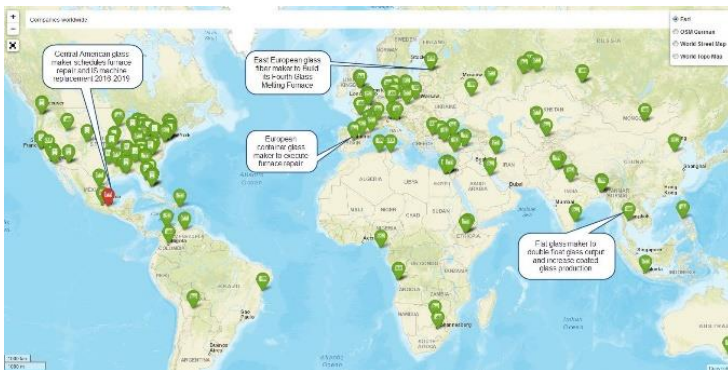
Fig. 3: Projetos existentes de fábricas de vidro a nível mundial

Tanto os fornecedores da indústria do vidro como os fabricantes, consultores, entre outros, podem fazer parte deste portal e ter acesso a toda a informação individualmente, dependendo das especificações dos utilizadores. É possível aceder a diversos projetos, com informações de planeamento de novas sedes, as localizações, investimentos e reparações.